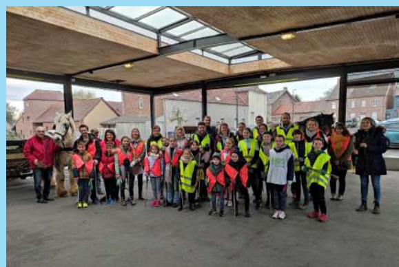
NETTOYAGE DE PRINTEMPS